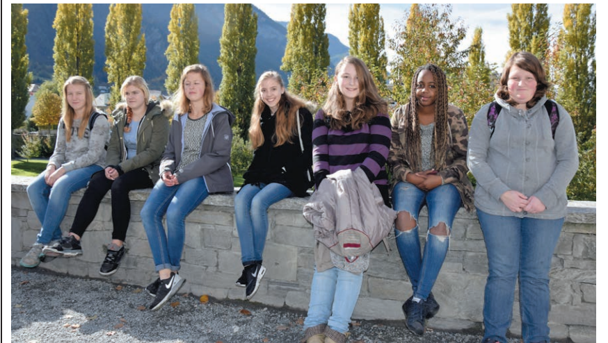
Truber Konfirmandinnen und Konfirmanden 2016

Beratungsstelle Ehe • Partnerschaft • Familie