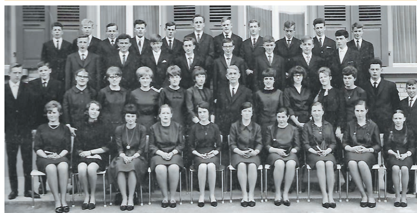
Am 20. März fand die Goldene Konfirmation des Jahrganges 1950 statt.