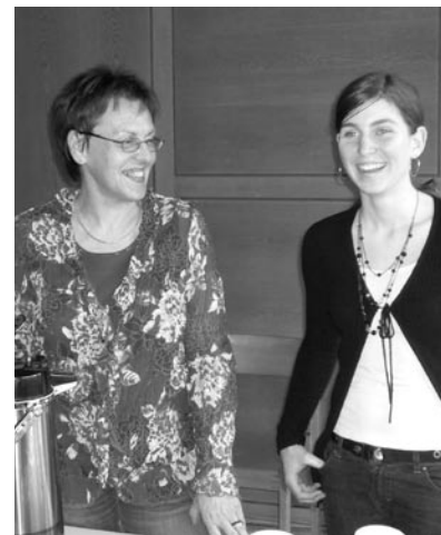
Helferinnen am Suppentag