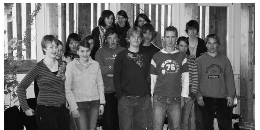
Konfirmandinnen und Konfirmanden der Realklasse

Konfirmation am 4. Mai 2008 Überlegungen zur Konfirmation Während des Unterrichts haben sich die Konfirmandinnen und Konfirmanden über die bevorstehende Konfirmation Gedanken gemacht.