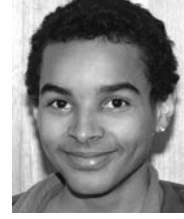
Kunz Bernardo Kirchmattenstrasse